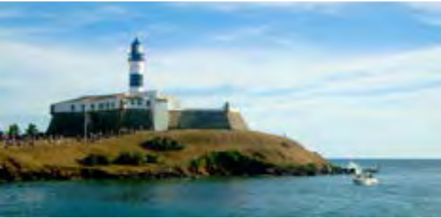
Faro de Barra.

En primer lugar, visité uno de los principales puntos turísticos de la ciudad, como el Faro de Barra .