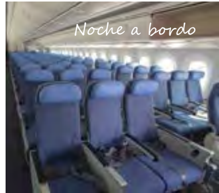
Noche a bordo

A la hora indicada por nuestros representantes, Nos recogieron en el hotel y trasladaron al aeropuerto para salir en vuelo regular de Air Europa con destino Madrid. Noche a bordo.